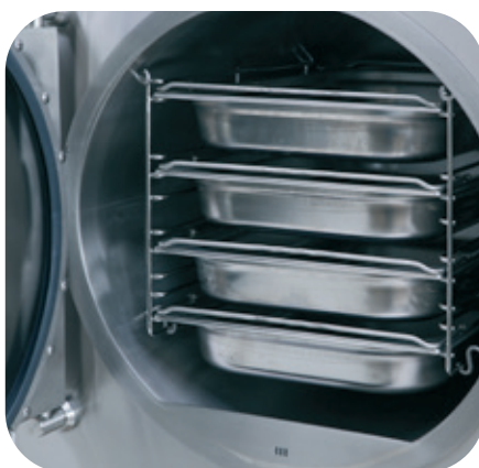
Vous pouvez faire simultanément différents plats, cuire 4 bacs GN 1/1 65 mm ou 3x GN 1/1 100 mm.