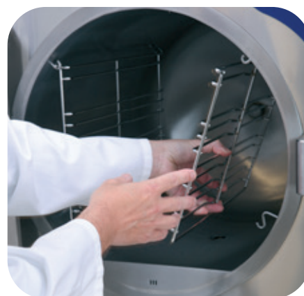
Les rails de guidage GN facilement amovibles aident à nettoyer la chambre. La douchette à rappel intégrée est une option.