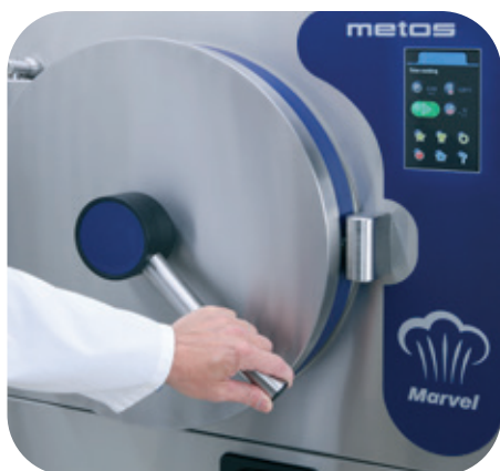
La poignée de porte à prise facile est conçue pour une utilisation d'une seule main