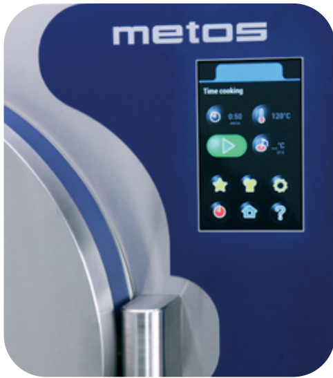
Interface à écran tactile multilingue