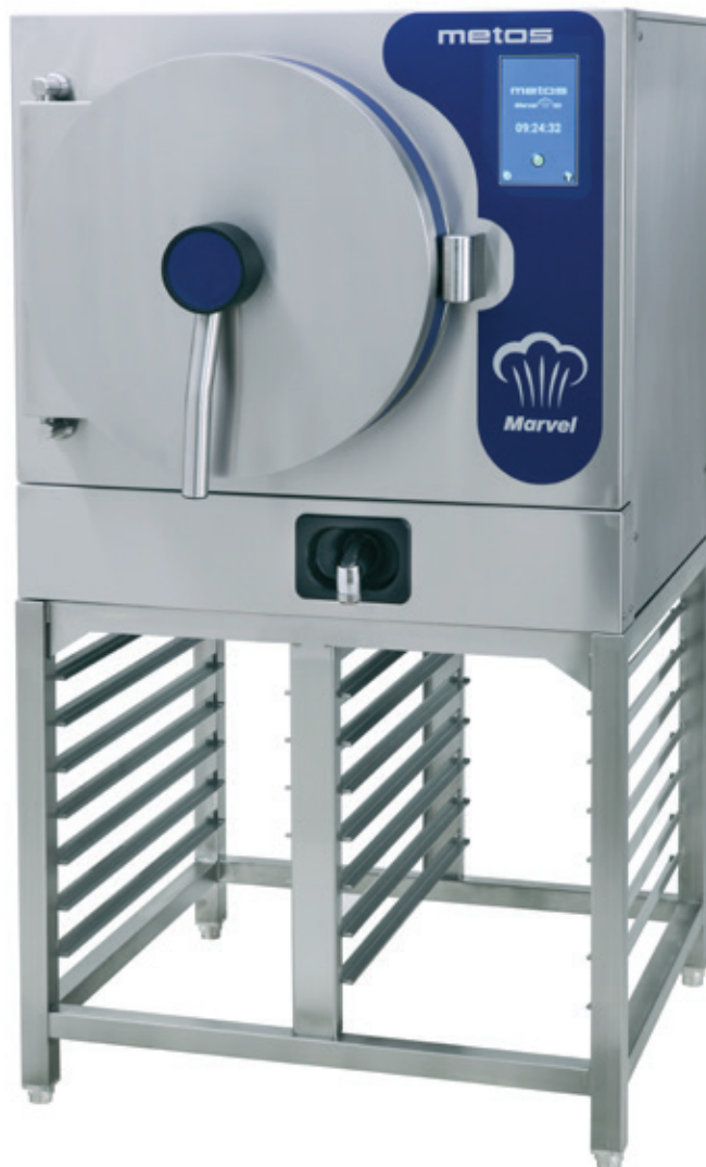
Metos Marvel TE1 avec support GN avec 2 x 7 rails GN

Avec Metos Marvel, vous pouvez répondre rapidement à l'évolution de la demande et réduire les pertes. Vous pouvez faire simultanément des plats différents, car les goûts et les arômes ne seront pas transférés d'un aliment à l'autre.