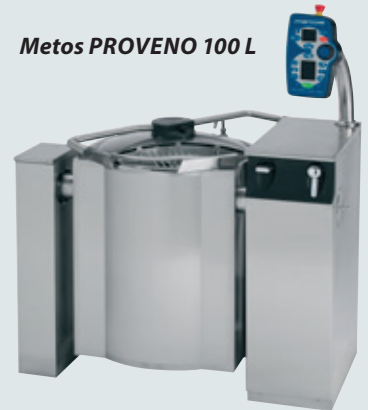
Metos PROVENO 100 L