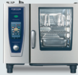
Metos SELFCOOKINGCENTER 61