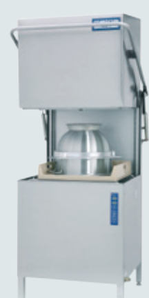
Metos WD-7 AUTOSTART ASTIANPESUKONE