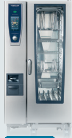
Metos SELFCOOKINGCENTER 201