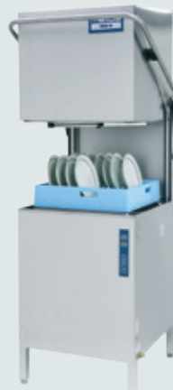
Metos WD-6 ASTIANPESUKONE