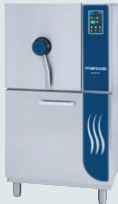
Metos MARVEL E1 PAINKEITTOKAAPPI