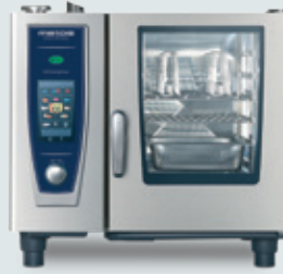
Metos SELFCKOOKINGCENTER 61