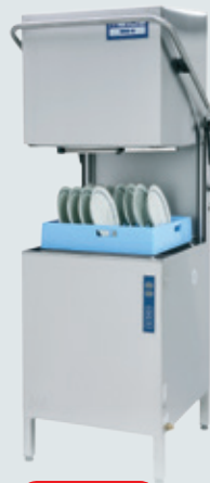
Metos WD-6 ASTIANPESUKONE