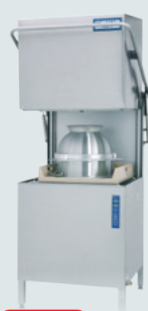
Metos WD-7 AUTOSTART ASTIANPESUKONE