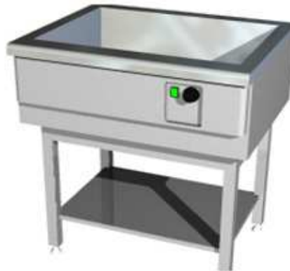
Marmitas su atviru stovu (talpa 1GN-4GN)