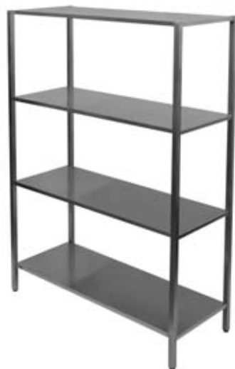
Suvirintas stelažas su 4 lentynomis