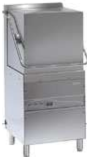
Indų plovimo mašina HOOD 80, 3F (pajėgumas 756 lėkščių/val)