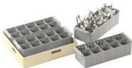
Plovimo indeliai įrankiams