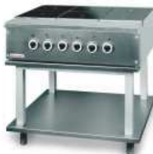
6 lankainių elektrinė viryklė 000.KEZ-6AA