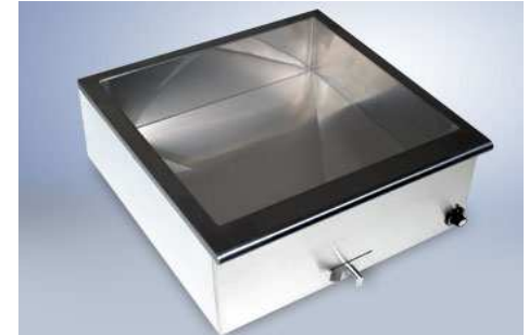
Įleidžiamas marmitas (talpa 1GN-4GN)