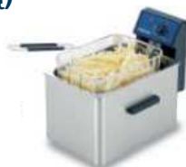
Gruzdintuvė (talpa 4-5 l)