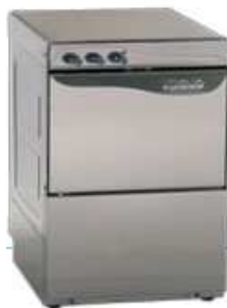
Indų plovimo mašina AQUA 50 MONO, 1F (pajėgumas 540 lėkščių/val)