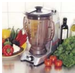
Maišytuvas (blenderis) (talpa 4 l)