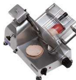
Gastronominė pjaustyklė Start 220