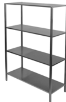
Suvirintas stelažas su 4 lentynomis