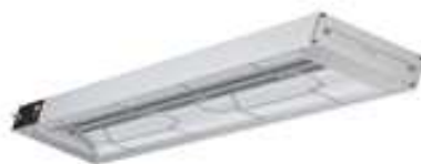
Kaitintuvas infra-raud. spindulių