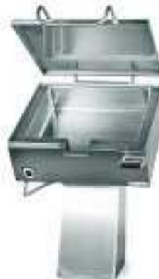
Elektrinė paverčiama keptuvė 000.PE-025N (talpa 37 l)