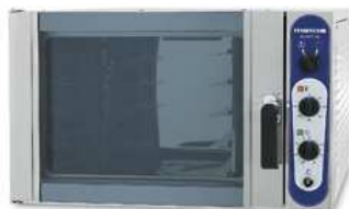
Konvekinė orkaitė Chef 50 (talpa 5 skardos)