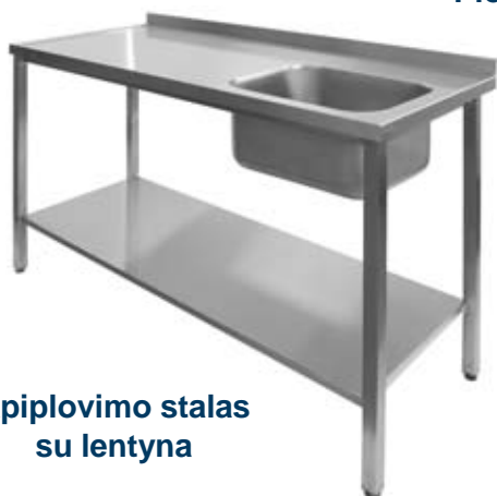
Apiplovimo stalas su lentyna