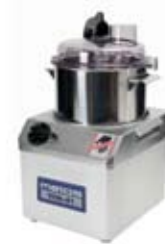
Pjaustytuvas (kuteris) (talpa 4-6 l)