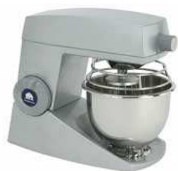
Universalus plaktuvas-maišytuvas (talpa 5 l)