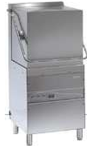
Indų plovimo mašina HOOD 110 XP TS, 3F (pajėgumas 1224 lėkščių/val)