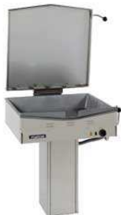
Elektrinė keptuvė SUPERPRINCE 20S (talpa 32 l)