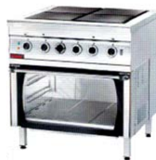
4 lankainių elektrinė viryklė su orkaite 000.KEZ-4u/PE-2