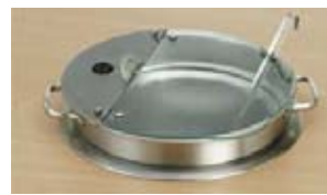
Įleidžiamas puodas sriubai (talpa 10 l)