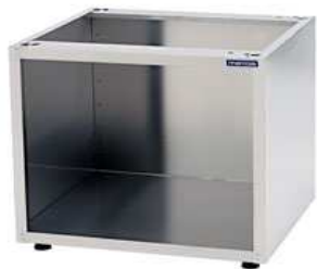
Stovas indų plovimo mašinai AQUA 50