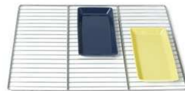
Nerūdijančio plieno grotelės