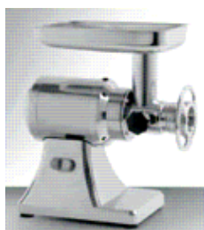
Mėsmaalė (našumas 150-300 kg/val)