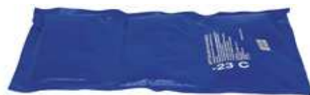
Šaldomasis elementas transportavimo dėžei