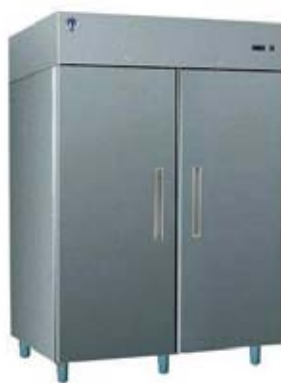
Šaldytuvas (talpa 1200 l)