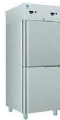
Šaldytuvas-šaldiklis (talpa 470+470 l)