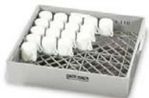
Kasetė puodeliams ir stiklinėms