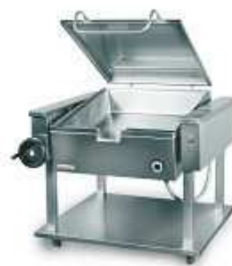
Elektrinė paverčiama keptuvė 000.PE-040N (talpa 64 l)