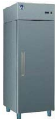
Šaldytuvas (talpa 470-600 l)