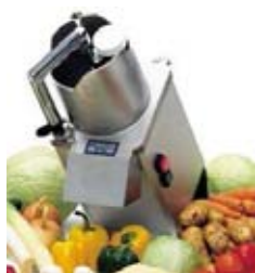
Daržovių pjaustyklė (našumas 2-40 kg/min)