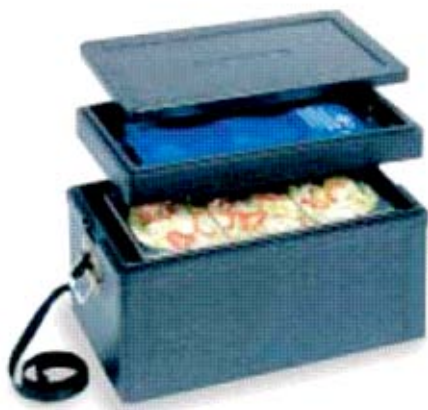
Transportavimo dėžė Metos Black GN1/1 su papildomu dangčiu ir šaldymo elementu (talpa 2xGN1/1-100 arba 3xGN1/1-65)