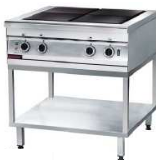
4 lankainių elektrinė viryklė 000.KEZ-4u.T