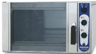
Elektrinė stat. kaitinimo orkaitė Chef 220 (talpa 1xGN2/1 arba 2xGN1/1)