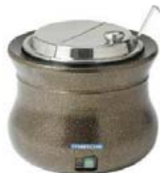
Puodas sriubai (talpa 8,3 l)