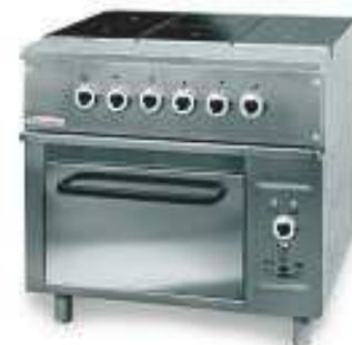
6 lankainių elektrinė viryklė su orkaite 000.KEZ-6PAA