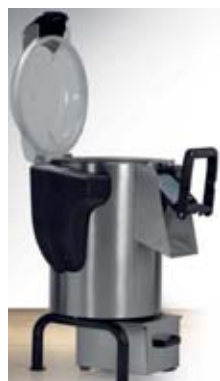
Bulvių plovimo ir valymo mašina (talpa 6-32 kg)