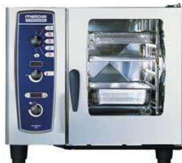
Konvekinė garo krosnis (talpa 6-20 skardų)