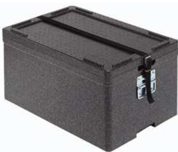
Transportavimo dėžė Metos Black GN1/1 (talpa 2xGN1/1-100 arba 3xGN1/1-65)