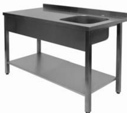
Stalas su plautuve, lentyna ir borteliu