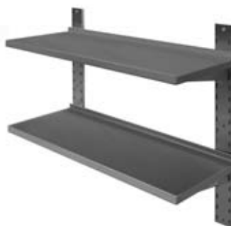
Pakabinama dviguba lentyna