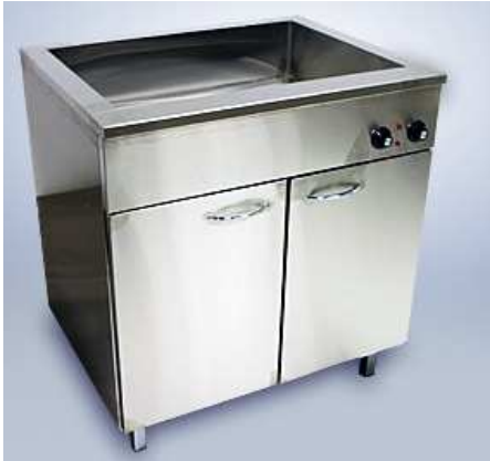
Marmitas su šildoma spintele (talpa 1GN-4GN)