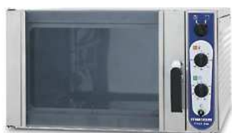
Konvekinė orkaitė su drėkinimu Chef 240 (talpa 2xGN2/1 arba 4xGN1/1)