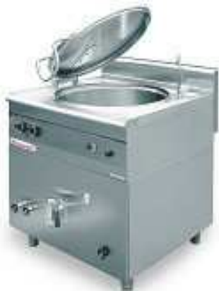
Elektrinis virimo katilas (talpa 80-200 l)