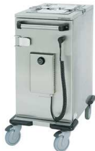
Terminis vežimėlis maistui Termia 950 HL (talpa 6xGN1/1-100)