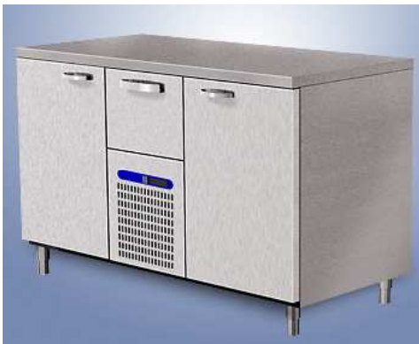
Šaldomas stalas (1-4 spintelės)