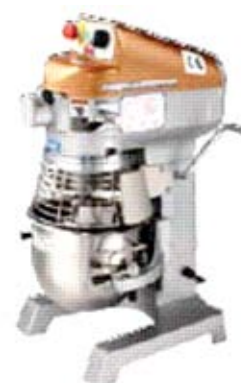
Plaktuvas-maišytuvas (talpa 10-76 l)