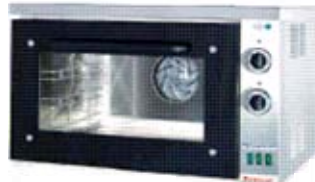
Elektrinė stat. kaitinimo konvekinė orkaitė 000.P- 3W (talpa 3xGN1/1)