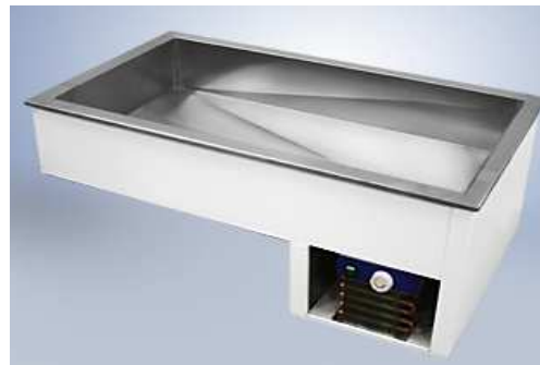
Įleidžiama šaldoma vonelė (talpa 1GN-4GN)