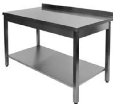
Stalas su lentyna ir borteliu