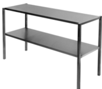
Pastatoma dviguba stalo lentyna