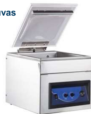
Vakuavimo aparatas Gastrovac Eco

UAB METOS, Vilniaus biuras J. Jasinskio g. 16f, LT-01112 Vilnius Tel. (5) 249 61 50, faks. (5) 249 61 48 www.metos.com