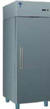
Šaldiklis (talpa 470-600-1200 l)