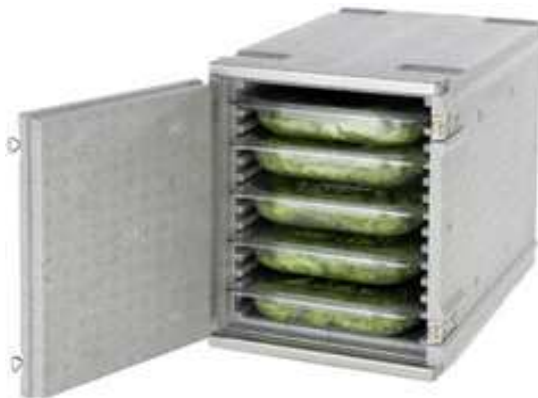
Termo dėžė EPP (talpa 5xGN1/1-65)