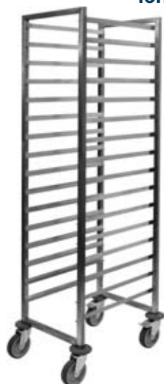
Vežimėlis gastronomiciems indams