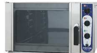
Kildinimo spinta Chef 200 (talpa 4xGN2/1 arba 8xGN1/1)