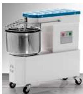
Tešlos maišyklė (talpa 12-44 kg)