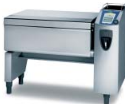
VarioCooking Center 311