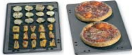
Grillaus- ja pizzapelti (sama pelti – kaksi paistopuolta)