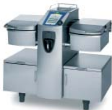
VarioCooking Center 112, kaksi pannua