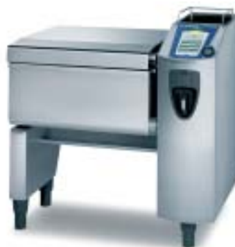
VarioCooking Center 211