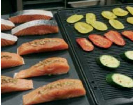
Grillatut tuotteet: suuri kapasiteetti, grillausraidat kuten parillalla