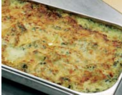
150 kg laatikkoruokaa kerralla n. 40 minuutissa (Metos SelfCooking Center 202)