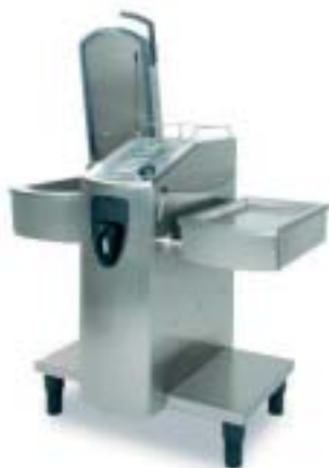
VarioCooking Center 111